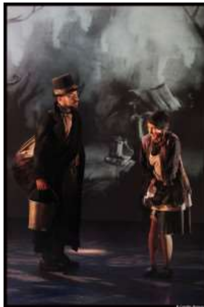
Cosette fait connaissance de Jean Valjean © Camille Ansquer